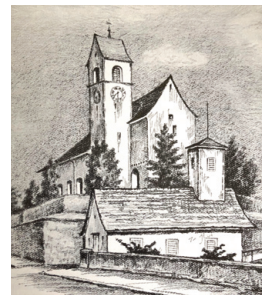
Die Kirche Rüti