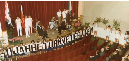
Rüti 1979: Obmännerversammlung am Vormittag.

Immer wieder führte der Name «Landsgemeinde» zu endlosen Diskussionen, dieser sei nämlich politischen Versammlungen vorbehalten. Aber einstweilen blieb es bei dieser Bezeichnung, auch im Jubiläumsjahr 1970, wo am 7. Juni wiederum in Rüti ein Grossaufmarsch an Veteranen in kameradschaftlichem und festlichem Rahmen das 50jährige Jubiläum ihrer Vereinigung feierten, die zu diesem Zeitpunkt rund 7'150 Mitglieder zählte. Dank dem Wohlwollen der Behörden, der ganzen Bevölkerung und des Wettergottes und der Unterstützung durch den Aktivverein und seinen Untersektionen organisierte die Veteranengruppe Rüti einen Jubiläumsanlass ohne Fehl und Tadel.