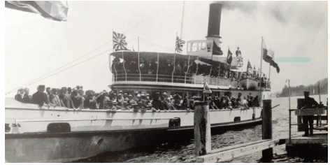
1929 Wädenswil: Sonderschiff statt Sonderzug.