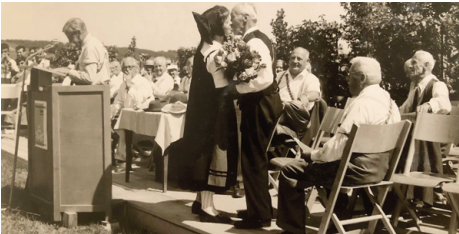
1960 Rafz: Ein Küsschen in Ehren...

1960 feierte der Kantonaltturnverein sein 100jähriges Bestehen - unter anderem mit einer Jubiläumsschrift, «die das schöne Sümmchen von 7'000 Franken kostete, was aber erträglich wurde, da die Veteranen 800 Stück à 5 Franken übernahmen». Die 40. Landsgemeinde im gleichen Jahr fand in Rafz statt, «wo es nicht nur gute Weine in den Kellern, sondern auch Geld im Kassenschrank der Gemeinde habe», beteiligte sich diese doch mit 800 Franken an den Kosten der Festhütte. Genehmigt wurde die Preiserhöhung für den obligatorischen Landsgemeinde-Festbündel von 50 Rappen auf 1 Franken.