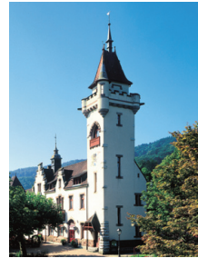
Albisgüetli: keine Jubiläumstagung 2021.

Wer hätte das gedacht? An seiner Sitzung vom 30. April 2020 musste das OK «Jubiläumstagung Veteranenvereinigung ZTV» in Abstimmung mit der Obmannschaft aufgrund der Covid-19 Vorgaben entscheiden, die für den 23. August 2020 im Schützenhaus Albisgüetli geplante 100. Turnveteranentagung ZTV abzusagen und auf den 29. August 2021 wiederum im Albisgüetli zu verschieben. Überhaupt war unser rundes Jubiläumsjahr ebenso vom Corona-Virus geprägt wie das sportliche und gesellschaftliche Jahr der ganzen Turnfamilie. Absage über Absage, wobei im Hintergrund immer die gesundheitliche Verantwortung gegenüber den mehrheitlich älteren Turnerinnen und Turnern stand. So fiel neben der Veteranentagung auch die in Stäfa geplante Obmännerversammlung dem Corona-Virus «zum Opfer».