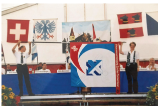
Unsere Fahne – immer dabei und im Mittelpunkt.

Ein wichtiges Anliegen der Veteranenvereinigung ist die Unterstützung des Turnsportes auf allen Ebenen – von der Jugendförderung über den Behinderten- bis hin zum Spitzensport. Insgesamt profitierte die Zürcher Turnfamilie von 1995 bis 2020 von finanziellen Beiträgen in der Höhe von rund 286'000 Franken – ein stolzer Betrag.