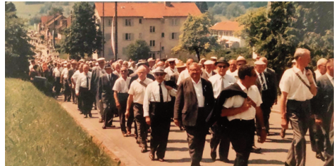
1987 Bonstetten: Das erste Farbfoto im Archiv!