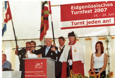
...und viele prominente Gäste und Redner.