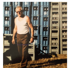
1980 Effretikon: Gerüstet für viele durstige Kehlen.