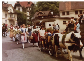
Auftakt zum Jubiläumsumzug.