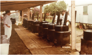
1984 Pfungen: Die Militärküchenchefs Wintethur u.U. sind einsatzbereit.

In den Satzungen ist festgehalten, dass die Veteranentagung möglichst im Juni stattzufinden hat. Aus besonderen Gründen kann sie aber auch zu einem anderen Zeitpunkt abgehalten werden. Dies war zwischen 1970 und 1995 nur dreimal der Fall: 1981 in Obfelden im Mai, 1993 anlässlich des Kantonalturfestes im unteren Tösstal im Juli und 1991 in Effretikon im September.