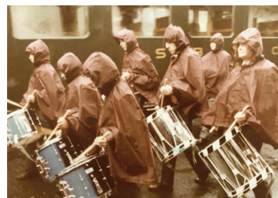
1979 Bülach: Auch die Tambouren hatten mit dem Regen zu kämpfen.