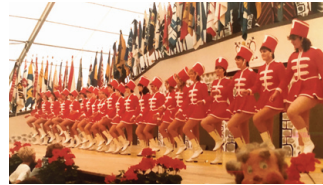
...und ihnen kurze Zeit später auf der Bühne mit jeder Garantie auch.