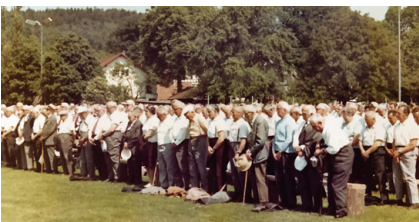
1972 Bassersdorf: Ehrung der verstorbenen Kameraden.

Während man in früheren Jahren die Landsgemeinden bewusst als separate Anlässe organisiert hatte um unnötigen «festlichen Klimbim und Chilbirummel» zu verhindern, erforderte der grosse Bedarf an Infrastruktur wie Festzelt, Verpflegungsmöglichkeiten und Rahmenprogramm ein Umdenken. Durch die Zusammenlegung des Veteranentages mit einer grösseren turnerischen Veranstaltung konnten mehrere Ziele erreicht werden: Keine speziellen Infrastrukturkosten für den Organisator, die Festwirtschaft profitiert vom Veteranentreffen und der Festkartenpreis für die Veteranen wird günstiger.