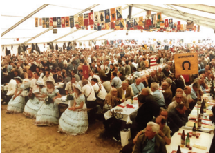
1987 Hüntwangen: Ehrendamen gehören zu jeder Veteranentagung.

In der Festschrift «25 Jahre Turnveteranenvereinigung» ist zu lesen: «Die Obmannschaft ist der belebende Mittelpunkt der Veteranenvereinigung». Daran hat sich nichts geändert. Ihr fällt weiterhin die Aufgabe zu, die Geschicke der Veteranenvereinigung zu steuern, Herausforderungen anzugehen wie insbesondere auch den sinkenden Stellenwert der Gemeinschaft älterer Turnerinnen und Turner innerhalb der Turnfamilie. Zudem muss sie Statuten, Reglemente und Weisungen laufend auf ihre Aktualität hin überprüfen und bei Bedarf deren Anpassung in Angriff nehmen. So ist beispielsweise die Veteranenvereinigung seit Inkrafttreten der neuen Statuten per 1. Januar 1992 eine dem Zürcher Turnverband angeschlossene Körperschaft. Durch die Teilnahme einer Vertretung an dessen Verbandsleiter-Konferenzen erhält die Obmannschaft wertvollen Einblick in die Tätigkeit des ZTV und dessen strategischen Zielsetzungen.