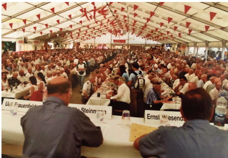
ETF Frauenfeld: Volles Festzelt...

Das traditionelle Jahrestreffen fand 24 Mal an verschiedenen, über den ganzen Kanton verteilten Austragungsorten statt. 2007 hingegen bot das Eidgenössische Turnfest in Frauenfeld den einzigartigen Rahmen für eine unvergessliche Veteranentagung, was für einmal zum Gang über die Kantonsgrenzen hinaus in den Thurgau motivierte.