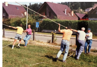
1991 Effretikon: Vor dem festlichen Vergnügen kommt die Arbeit.