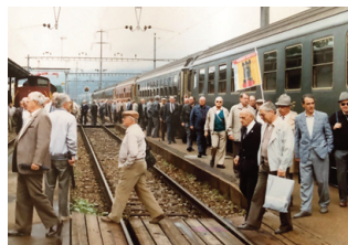
1990 Watt: Der Bahnhof Regensdorf macht dem HB Zürich Konkurrenz.