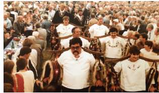
1985 Samstagern: Ihnen ist die volle Aufmerksamkeit garantiert...