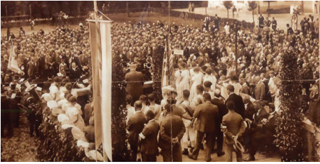
1927 Töss: Grossaufmarsch am Kantonaltturnfest.

Die Gründung der Veteranenvereinigung führte zu unterschiedlichen Reaktionen. Hier die turnfreundliche Bevölkerung und die Aktivsektionen, die den Zusammenschluss der alten Turnergarde begrüßten, dort politische Exponenten, die zum Ziel hatten, die solide Basis der Turnerei zu untergraben. Doch der am 11. Juli 1920 in Rüti gesetzte Samen gedieh, selbst wenn in Aktivsektionen oft Zeit und Geduld erforderlich waren um der Veteranensache zum Durchbruch zu verhelfen.