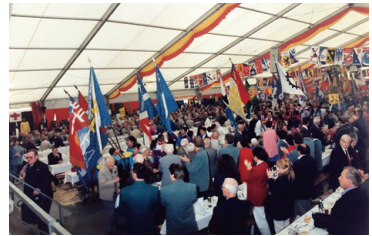
Der Einzug der Fahnen ins Festzelt.