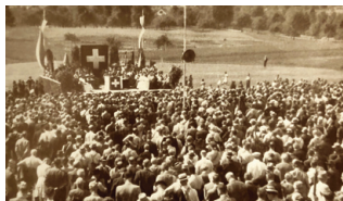
2'166 Veteranen genossen auf der «Rosenburg» einen sonnige Jubiläums-Landsgemeinde.