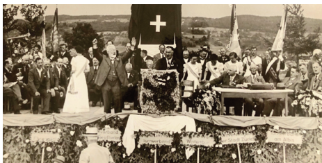
1937 Kloten: Er gibt im Turnerlied den Takt an.

Da bei den Aktivsektionen die Erkenntnis wuchs, dass Veteranen eine wertvolle Stütze sein können, förderten sie deren Einbindung. So kam es, dass zehn Jahre nach der Gründung die Mitgliederzahl von 900 auf 2'000 gestiegen war. Im Jubiläumsjahr 1945 zählte die Veteranenvereinigung in 115 Sektionen bereits 4'344 Mitglieder. In der Jubiläumsbroschüre 1920 – 1945 ist zu lesen: «Bei der Mitgliederbewegung mitbestimmend ist natürlich auch der regelmässige Verlust durch Tod, welcher den Turnveteranen leider kein Vorrecht einräumt».