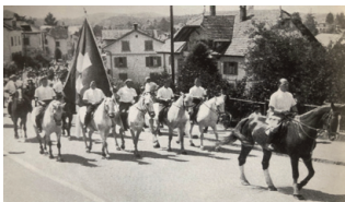
Der grosse Festumzug zum Versammlungsort wurde angeführt von einer Reitergruppe mit Schweizerfahne.

Im Gründungsort Rütli fand am 3. Juni 1945 die Jubiläums-Landsgemeinde mit 2'166 Turnveteranen statt. «Es brauchte nur noch die Gunst des Wettermachers, um eine würdige Landsgemeinde gesichert zu wissen. Der Himmel kargte mit dem erhofften Beitrag an Sonne, Wärme und Bläue nicht». Am Vormittag fand die inzwischen traditionelle Obmännerversammlung statt, am Nachmittag marschierten dann die Veteranen musikalisch begleitet zum Tagungsort, wo ein eindrücklicher Jubiläumsanlass über die Bühne ging. Nachdem man gut zwei Stunden in der Sonne ausgeharrt hatte, traf man sich unter schattigen Bäumen, wo gewürdigt wurde, «was Küche und Keller zu spenden imstande waren...».