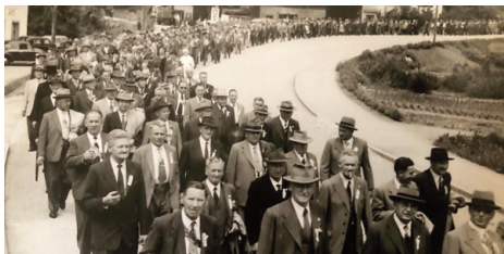
1952 Hedingen: Beeindruckender Einzug der Veteranen.

1949 wurden die Veteranen zum Besuch des Kantonalturfestes Winterthur eingeladen. 1'000 pilgerten in die Eulachstadt, was als «sehr bescheiden» kritisiert wurde. 1951 traf man sich in Hedingen zur Landsgemeinde. Auch die Lokomotive eines Extrazuges schien im Veteranenalter zu sein, ging ihr doch auf halbem Weg der Schnauf aus. Ein Jahr später in Gossau gab der Antrag zu reden, die Landsgemeinden seien zu straffen. Mit der Feststellung, «durch eine allzu rigorose Kürzung verlören diese an edlem Inhalt und wohlthuender Wärme», war das Thema rasch vom Tisch.