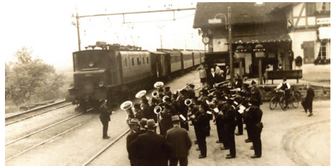
1935 Wiesendangen: Der Extrazug fährt ein.

Die Obmannschaft vermied bewusst die Zusammenlegung der Landsgemeinde mit anderen Anlässen, um «jeglichen Chilbirummel» auszuschliessen. Nur vier Ausnahmen innert 25 Jahren wurden gemacht: 1927, 1930, 1934 und 1938 wurden die Landsgemeinden im Rahmen der Kantonaltturnfeste Töss, Altstetten, Küsnacht und Wädenswil organisiert, um den alten Turnern die Möglichkeit zu bieten, «sich an den Leistungen der Jungen zu erfreuen». Zu erwähnen ist, dass zur Landsgemeinde 1928 in Rorbas erstmals ein Extrazug zum Einsatz kam und dass 1929 der Tagungsort Wädenswil gar mit einem Extraschiff erreicht wurde, wo übrigens nach intensiver Diskussion die Schaffung einer Veteranen-Fahne abgelehnt wurde, «da das Banner des Kantonaltturnvereins das gemeinsame Symbol sowohl für die jungen als auch für die alten Turner ist».