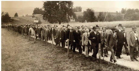
1943 Schlieren: Auf dem Marsch zum Besammlungsort.