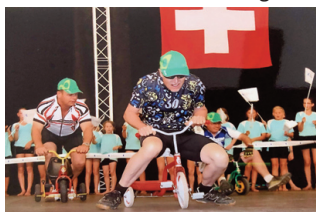
2014 Ossingen: ein bisschen Spass muss auch an unseren Anlässen sein.