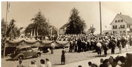
1950 Rheinau: Ein Oldtimer unter «Oldtimern».

1949 wurden die Veteranen zum Besuch des Kantonalturfestes Winterthur eingeladen. 1'000 pilgerten in die Eulachstadt, was als «sehr bescheiden» kritisiert wurde. 1951 traf man sich in Hedingen zur Landsgemeinde. Auch die Lokomotive eines Extrazuges schien im Veteranenalter zu sein, ging ihr doch auf halbem Weg der Schnauf aus. Ein Jahr später in Gossau gab der Antrag zu reden, die Landsgemeinden seien zu straffen. Mit der Feststellung, «durch eine allzu rigorose Kürzung verlören diese an edlem Inhalt und wohlthuender Wärme», war das Thema rasch vom Tisch.