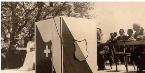
1948 Bassersdorf: Ein imposantes Rednerpult.

In den folgenden Jahren erlebte die Veteranenvereinigung eine kontinuierliche Entwicklung. Was manchmal zu Problemen führte, war die ungenügende Benutzung der von den SBB nach langen Verhandlungen bewilligten Extrazüge an die Landsgemeinden. «Schlimm war es 1968 in Egg, als sich die Gruppen bei weitem nicht an die gemeldeten Zahlen hielten, sondern wohl wegen des etwas abgelegenen Festortes Autos oder Cars vorzogen».