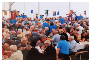
2019 Trüllikon: unsere bisher letzte Tagung - dann kam Corona.