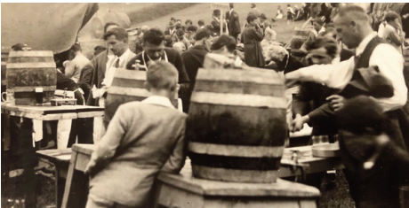
1932 Höngg: Durst war schon damals kein Fremdwort.

In den Satzungen war festgelegt, dass mit Zusammenkünften für ein «gesundes Eigenleben» zu sorgen war, was in Form der üblicherweise im Freien durchgeführten Landsgemeinde eindrücklich umgesetzt wurde, die zugleich beste Werbung für die Sache der Turnveteranen machten. Die erste fand 1921 in Wallisellen statt, wobei sich die Obmannschaft bewusst war, «dass Ernst und Frohsinn im bekömmlichen Verhältnis zur Geltung zu kommen hatten». Den Auftakt machte jeweils der gemeinsame Marsch vom Bahnhof oder Besammlungsort zum Tagungsplatz, begleitet vom örtlichen Musikverein. Wohl einer der nachhaltigsten Beschlüsse der ersten Landsgemeinde war ein obligatorisches Veteranenabzeichen zu schaffen.