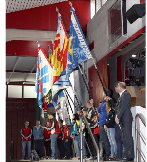
Die Mitgliedervereine des Trägervereins KTF 2023