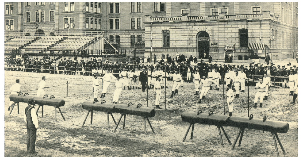
Eidg. Turnfest Zürich 1903 auf dem Kasernenplatz

25 Jahre – Gründung 1995 Faustball Wallisellen