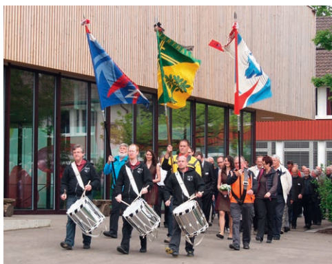
Auf dem Weg ins Festzelt.

Kameradschaftlicher Höhepunkt ist die kantonale Veteranentagung, in der vor allem die Ehrungen der älteren Mitglieder und das Gedenken an die verstorbenen Kameradinnen und Kameraden im Mittelpunkt stehen.