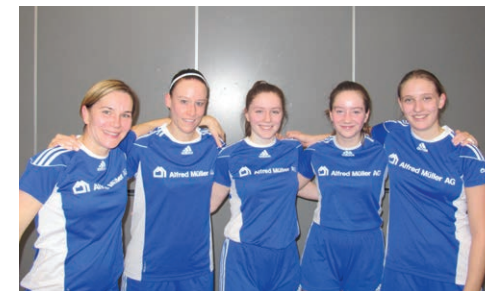
Hausen am Albis

Besten Dank allen Schiris, Coaches und euch Spielerinnen für die tollen Spiele!