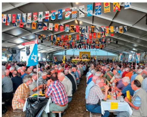
Die jährliche Veteranentagung – ein grosses, geselliges Kameradschaftstreffen.