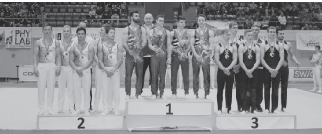
Podest Nationalliga A