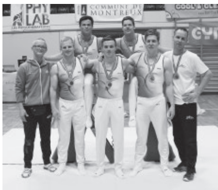
Team Zürich 1, Nationalliga A

Übung mit Sturz musste jedoch in die Wertung aufgenommen werden. Die Zürcher gaben trotzdem nicht auf und kämpften sich zurück.