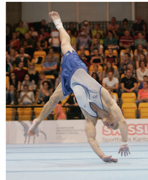
10 Jahre später an der SM 2015 feierte er seinen schönsten Wettkampf